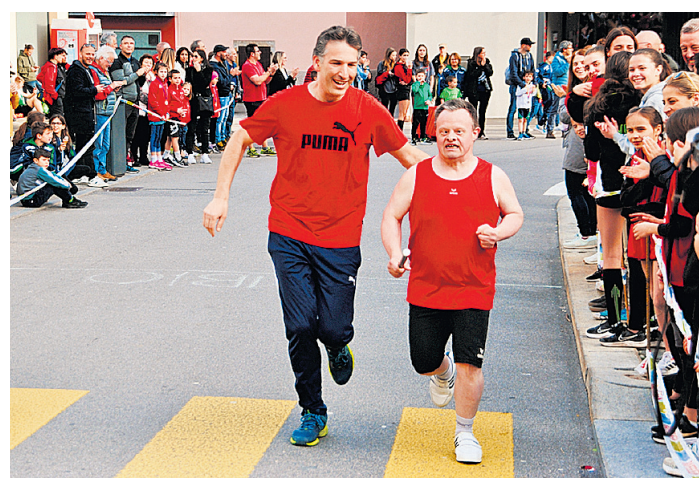
L'arrivo della prima staffetta inclusiva di Tesserete.

Il calendario estivo e invernale è sempre fitto e non solo gli atleti impegnati in gare individuali o di squadra si confrontano con quelle emozioni che regala a tutti lo sport: «Queste esperienze concrete attivano la motivazione e spingono ognuno ad attingere alle proprie risorse, contribuendo ad abbattere le barriere. Ogni